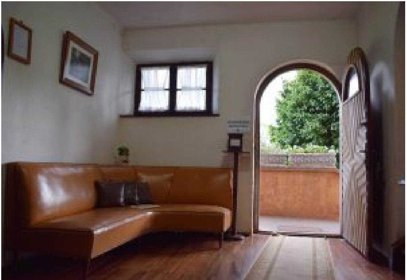
Cenário para belas fotos.

A visita é rápida e em poucos minutos é possível passar por todos os cômodos da casa e conhecer a história da cidade de Treze Tílias. E para quem gosta de antiguidades e de história, a vontade é morar por ali.